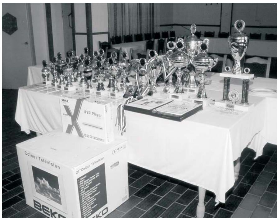
Nagrade takmičarima za 2009. godinu.