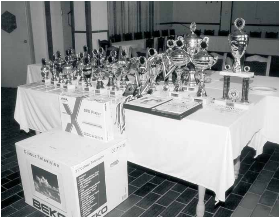
Nagrade takmičarima za 2008. godinu.

Predsedništvo i predsednici klubova pohvalili su rad Predsednika Takmičarske komisije JUTS-a Vladice Markovića iz Ćirikovca. - Doneta je odluka da visinu takmičarske takse odredi Pred. na prvj sednici posle skupljanja članarine, kupovina nagrada (pehara, robnih nagrada) i štampanja diploma i zapisnika.