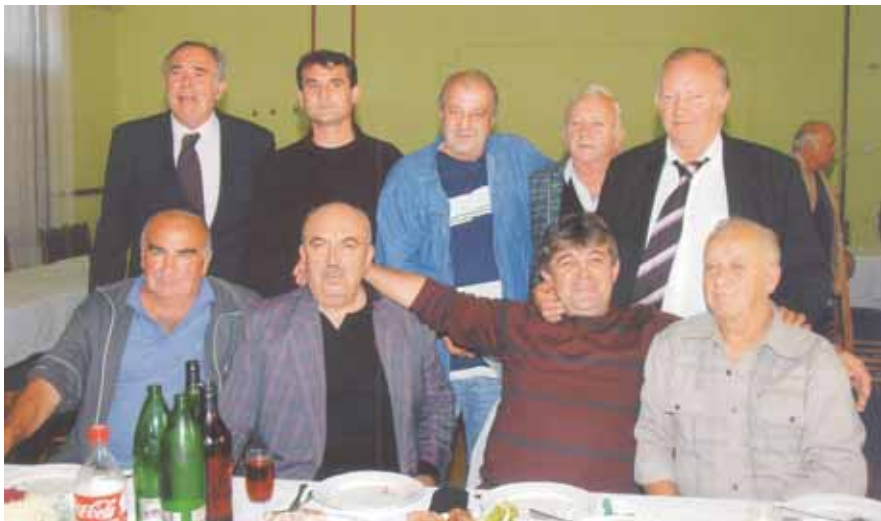
Gosti na Skupštini