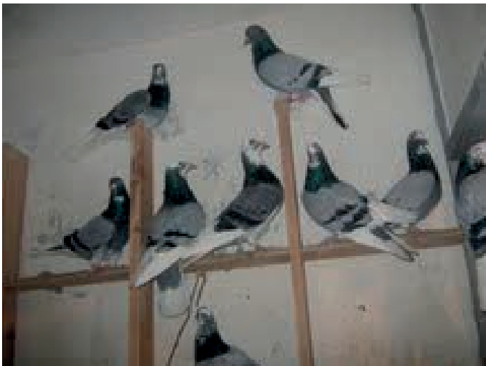
Golubovi Vojkić Đorđa iz Zemuna Seniorski pobjednik 2012. god.